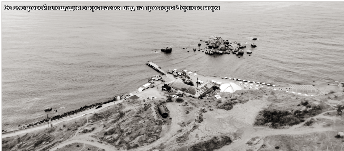
Со смотровой площадки открывается вид на просторы Черного моря

храм-мечеть, тоже превращенный в музей, или спуститься в одно из двух хранилищ глубоко под землю. В одном из них ранее находился склад, второе называлось цистерной и служило резервуаром для воды на случай осады.