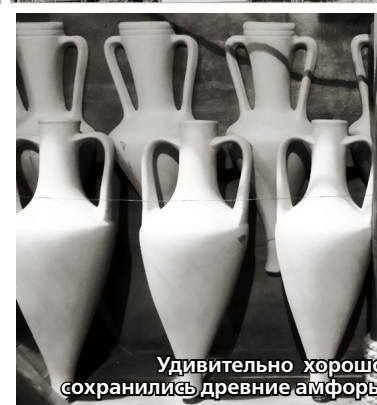
Удивительно хорошо сохранились древние амфоры

С этим местом связана еще одна легенда: когда защитники Солдайи после длительной турецкой осады обессилили, врагам удалось ворваться в крепость. Захватчики подожгли церковь, в которой спрятались горожане. Все они вместе с консулом Христофором ди Негро