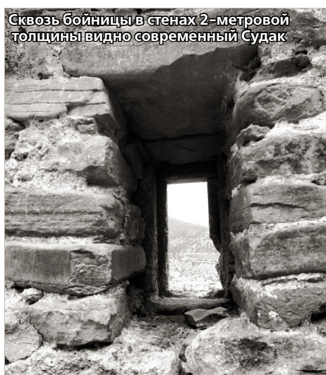
Сквозь бойницы в стенах 2-метровой толщины видно современный Судак