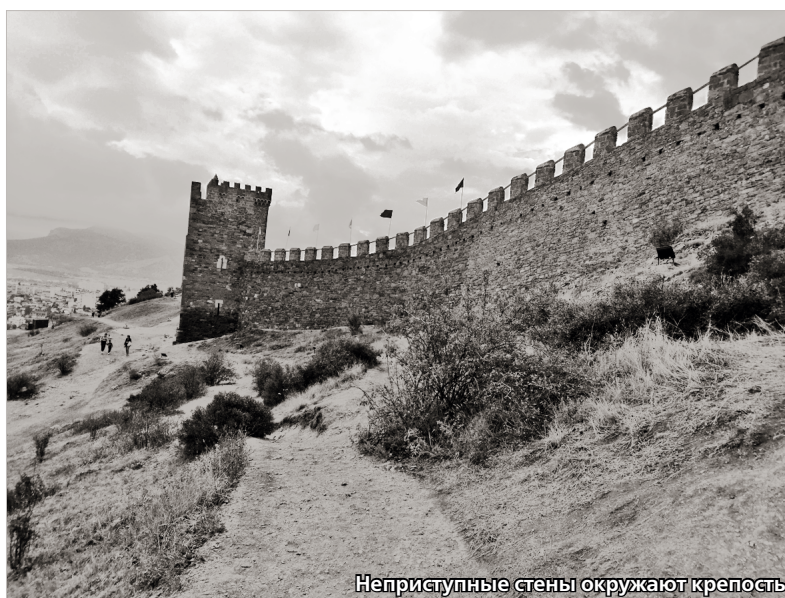
Неприступные стены окружают крепость