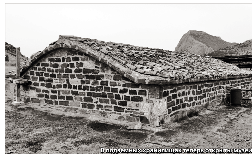
В подземных хранилищах теперь открыты музеи