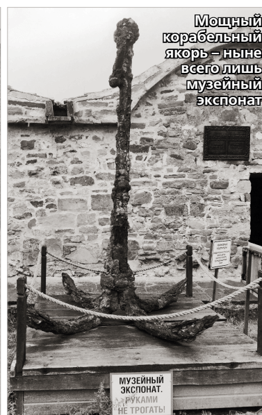
Мощный корабельный якорь – ныне всего лишь музейный экспонат